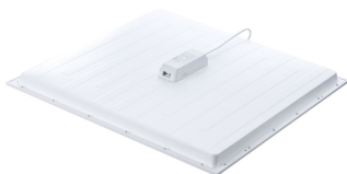
Ledinaire Panel 4100lm backside