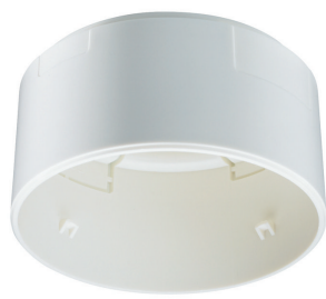
LRH1070/00 SENSR SURFACE BOX