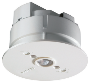
LRM1070/00 SENSR MOV DET ST