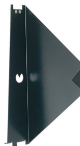
Simple aiming device