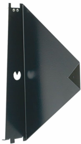
Jednoduché zařízení pro zaměření