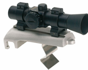
Zařízení pro přesné zaměření