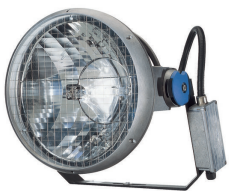
MVF403 - MASTER MHN-LA - 1000 W