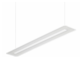
SmartBalance Suspended Mounted - LED Module, system flux 3500 lm